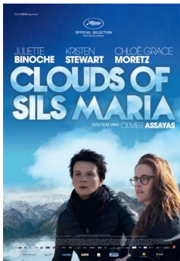
Viaje a Sils Maria Oliver Assayas (França)